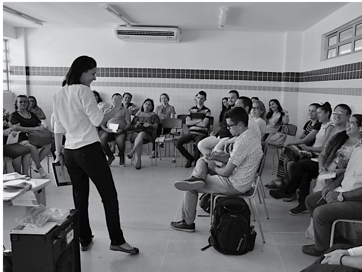
Em João Pessoa, a formação iniciou quarta-feira e é encerrada ontem no Centro de Formação de Educadores Elisa Bezerra de Mineiros em Mangabeira