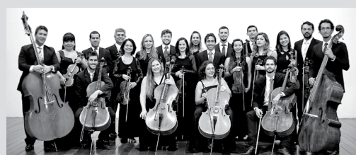
Nesta temporada de 2017, a OSUFPP está homenageando nomes importantes da cultura paraibana