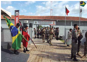
Governador Ricardo Coutinho inaugurou, em Sousa, as novas instalações do 14º BPM, assinou OS do Cidade Madura e entregou comendas militares