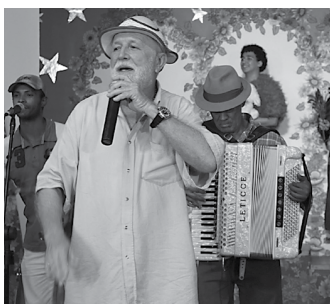
Ornisco é conhecido por seu raciocínio rápido e tiradas espirituosas

Conhecido pelo raciocínio rápido e a simplicidade com que desenvolve tiradas espirituosas e brilhantes, bem como pelos trocadilhos - "me sinto muito bem quando sou incluído na relação dos chamados 'artistas da terra', pois desconheço artistas de outros planetas", "tem gente fazendo