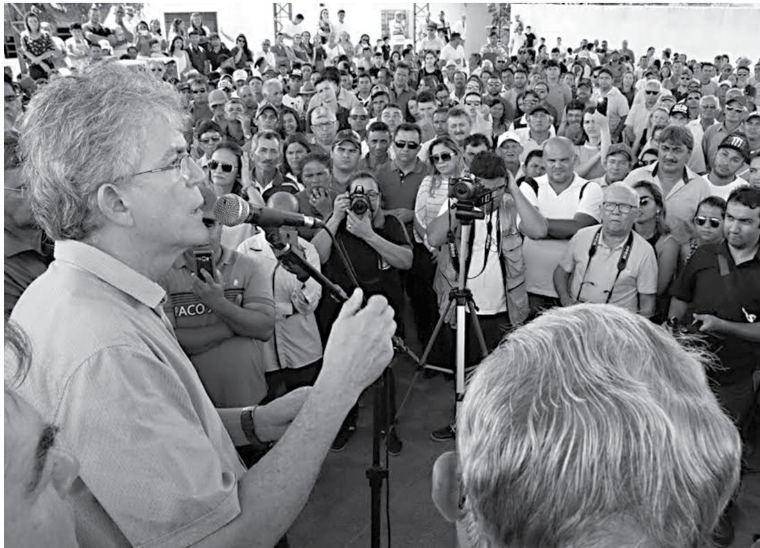
Durante a inauguração, o governador Ricardo Coutinho manifestou sua alegria e comemorou o fato da Paraíba inaugurar uma obra rodoviária a cada 18 dias no seu governo dentro do programa Caminhos da Paraíba.